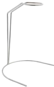
Porte couvercle haut High lid rest P.135

Conçu pour présenter les couvercles au-dessus de leur base : Il est hygiénique (pare haleine) et le couvercle est facile à saisir. Il valorise les différentes couleurs et tailles de couvercles.