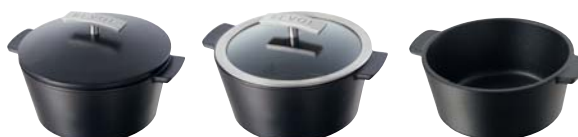
* 649336 * 649337 * 647868