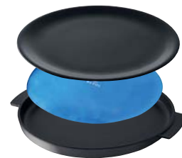
Maintien au froid Cold Display P.134

Revol created two inserts, one for steaming, the other for a double boiler, so that your dishes do not dry out or burn by staying on the buffet during service. Thus each recipe can preserve its authenticity without spoiling.