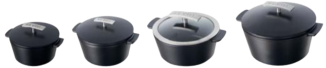
4 tailles de cocottes base noire effet fonte (ø 10 à 19 cm) - P.133 4 sizes of cast iron style base cocottes (ø 4 ¼" to 7 ½") - P.133