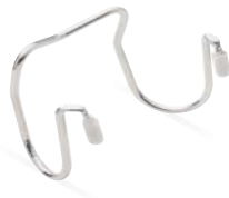
Porte couvercle bas Low lid rest P.135

Designed to hold lids on top of their base: it is hygienic (sneeze guard) and the lid is easy to grab. It enhances the different colours and shapes of the lids.