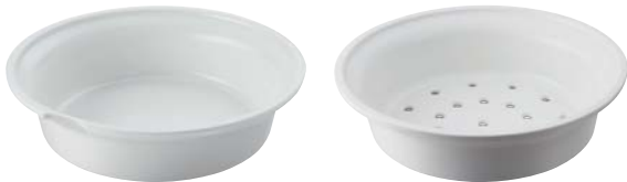
Inserts Inserts P.134

Revol a créé deux inserts, l'un pour la cuisson vapeur, l'autre pour le bain marie pour ne pas que vos préparations séchent ou brûlent en restant sur le buffet durant le service. Ainsi chaque recette peut préserver son authenticité et ne pas s'altérer.