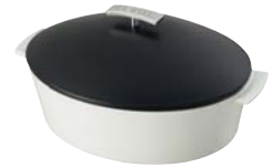
1 cocotte ovale (ø 32 cm) - P.131 1 ovale cocotte (ø 12 3/4") - P.131