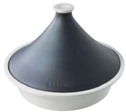
1 tajine (ø 32 cm) - P.131 1 tajine (ø 12 1/2") - P.131