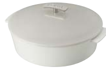
1 cocotte basse (ø 28 cm) - P.131 1 shallow cocotte (ø 11") - P.131