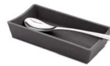
Repose cuillère Spoon rest P.135

Designed to keep the lid behind the cocotte: it takes up little space, and enhances the different colours and shapes of the lids.