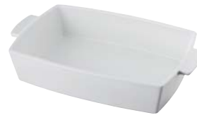
1 plat rectangulaire (ø 30 cm) - P.131 1 rectangular dish (ø 12") - P.131