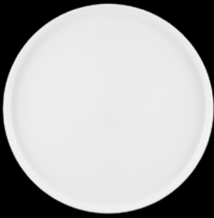
FIORD 21133893 Prato Marcador 32 Charger Plate 32 Plato Presentación 32 Assiette de Présentation 32 △ 935 gr A 19 mm Ø 320 mm △ 2 1/6 lbs H 3/4" Ø 10 1/4"