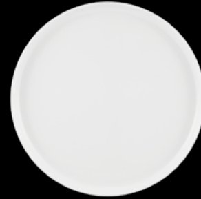
FIORD 21133894 Prato Raso 28 Dinner Plate 28 Plato Llano 28 Assiette Plate 28 △ 800 gr A 19 mm Ø 278 mm △ 1 3/4 lbs H 3/4" Ø 11"