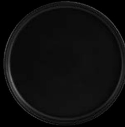
FIORD 27020940 Prato Sobremesa 19 Dessert Plate 19 Plato Postre 19 Assiette à Dessert 19 △ 480 gr A 21 mm Ø 185 mm △ 1 lbs H 5/8" Ø 7 3/4"