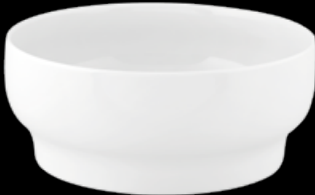
FIORD 21133890 Saladeira 25 Salad Bowl 25 Ensaladera 25 Saladier 25 △ 1350 gr A 103 mm Ø 249 mm △ 3 lbs H 4" Ø 9 3/4"