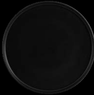
FIORD 27020939 Prato Raso 26 Dinner Plate 26 Plato Llano 26 Assiette Plate 26 △ 980 gr A 21 mm Ø 260 mm △ 2 1/6 lbs H 5/8" Ø 10 1/4"