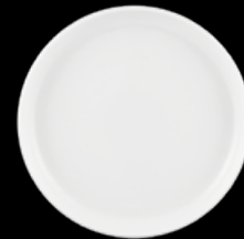
FIORD 21133896 Prato Pão 16 Bread & Butter Plate 16 Plato Pan 16 Assiette à Pain 16 △ 285 gr A 17 mm Ø 160 mm △ 5/8 lbs H 3/4" Ø 6 3/4"