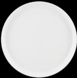
FIORD 21133895 Prato Sobremesa 22 Dessert Plate 22 Plato Postre 22 Assiette à Dessert 22 △ 545 gr A 19 mm Ø 220 mm △ 1 1/5 lbs H 3/4" Ø 8 3/4"