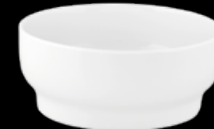
FIORD 21133888 Tigela 16 Bowl 16 Bowl 16 Bol 16 △ 350 gr A 59 mm Ø 139 mm △ 7/8 lbs H 2 1/2" Ø 5 1/2"