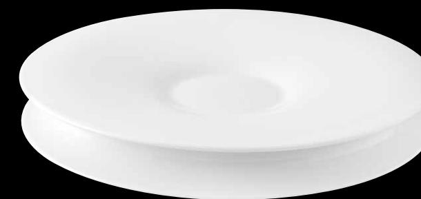
SATURN 21131017 Prato 28 Plate 28 Plato 28 Assiette 28 △ 1280 gr A 42 mm Ø 279 mm △ 2 5/8 lbs H 1 3/8" Ø 11"