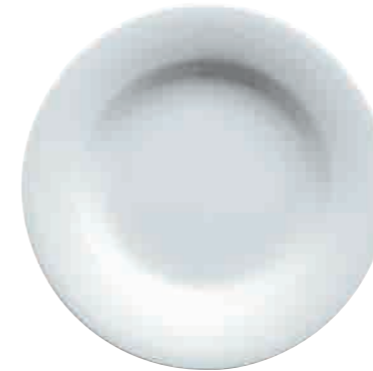
Teller, tief plate, deep 30 cm Art. Nr. 63 3484