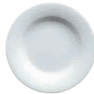
Teller, tief plate, deep 24,5 cm Art. Nr. 63 3483