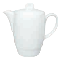
Kaffeekanne komplett coffee pot with lid 0,50 l Art. Nr. 63 1126