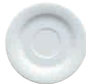
Kombi-Untertasse saucer 15 cm Art. Nr. 63 3545