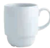
Kaffeebecher, stapelbar mug, stackable 0,32 l Art. Nr. 63 5325