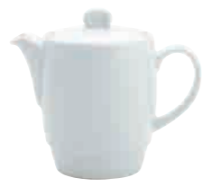
Teekanne komplett tea pot with lid 0,40 l Art. Nr. 63 1413