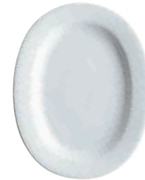
Platte, oval platter, oval 29 cm Art. Nr. 63 3345