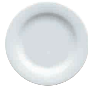
Teller, flach plate, flat 16 cm Art. Nr. 63 3478