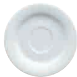
Espresso-Untertasse espresso saucer 12 cm Art. Nr. 63 3544