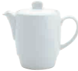
Teekanne komplett tea pot with lid 0,70 l Art. Nr. 63 1414