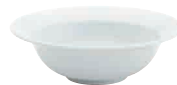
1,00 l, 23 x 7 cm Art. Nr. 63 2971