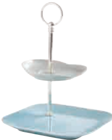
Cumulus Et Centuries Étagère tiered stand 2 pcs. 15,5 cm / 22 cm H 24,5 cm Art. Nr. 42 7874