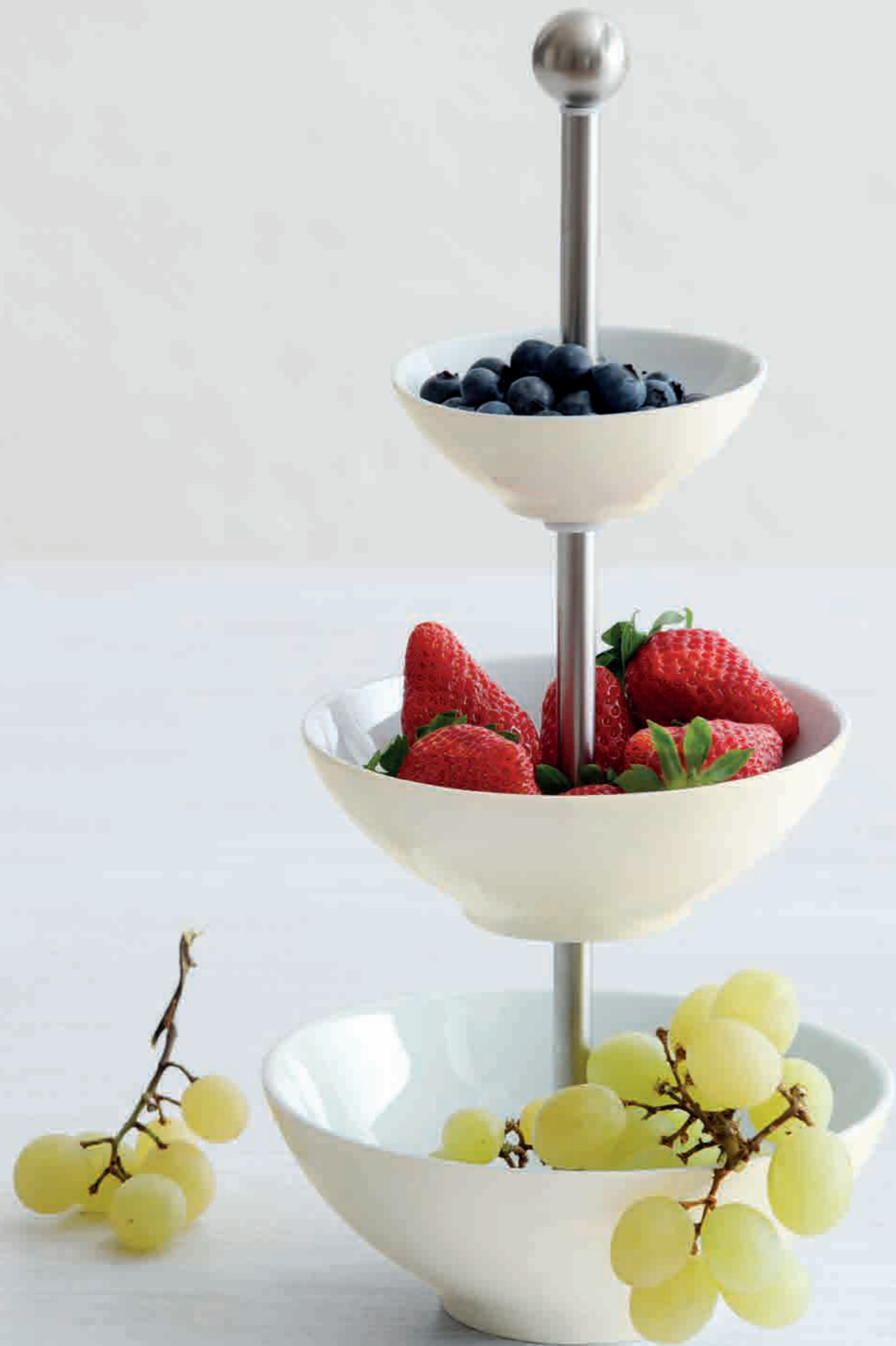
Diner Étagère tiered stand