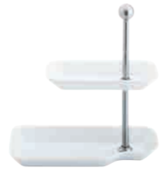
Cumulus Étagère tiered stand rectangular, 18 cm / 23 cm Art. Nr. 42 7814