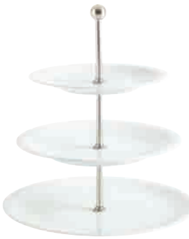
Update Étagère tiered stand 3 pcs. 21,5 cm / 26 cm / 31 cm H 33 cm Art. Nr. 32 7811