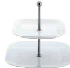
Cumulus Étagère tiered stand square, 22 cm / 27 cm Art. Nr. 42 7813