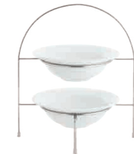
All Stars Halter mit 2 Schalen rack with 2 bowls 20 cm Art. Nr. 63 B256