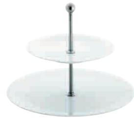
Update Étagère tiered stand 2 pcs. 21,5 cm / 31 cm H 23 cm Art. Nr. 32 7812