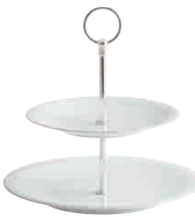
Centuries Étagère tiered stand 2 pcs. 21,5 cm / 28,5 cm Art. Nr. 35 7728