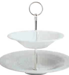
Centuries stone tiered stand 2 pcs. 22 cm / 30 cm Art. Nr. 30 7873