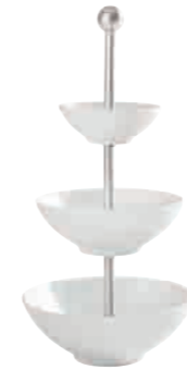
Diner Étagère tiered stand 3 pcs. 9 cm / 13 cm / 16 cm H 33 cm Art. Nr. 55 7871