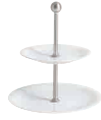
Café Sommelier Étagère tiered stand 2 pcs. 16 cm / 21,5 cm H 23 cm Art. Nr. 21 7843