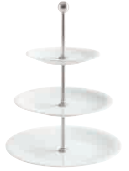
Update Étagère tiered stand 3 pcs. 16 cm / 21,5 cm / 26,5 cm H 33 cm Art. Nr. 32 7848