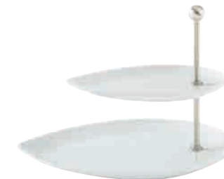
Diner Étagère tiered stand 2 pcs. 24 cm / 32 cm H 33 cm Art. Nr. 55 7875