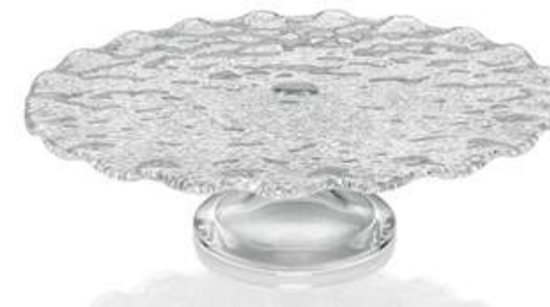
6670.1 / 6627.1