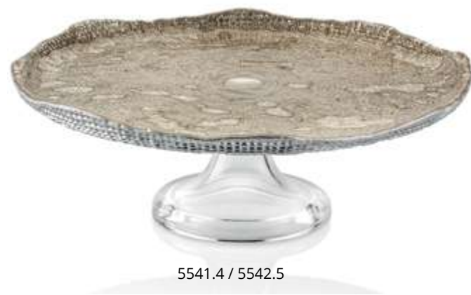
5541.4 / 5542.5

5542.1 Ø cm. 32 - h cm. 11,5 Ø inch. 12,6 - h inch. 4,5