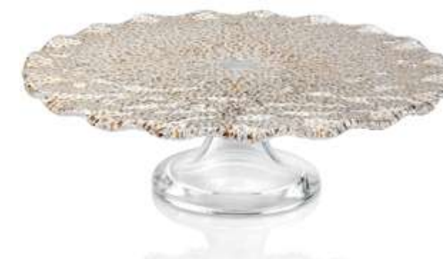
6670.2 / 6627.2

6627.1 Ø cm. 33 - h cm. 9,5 Ø inch. 13 - h inch. 3,7