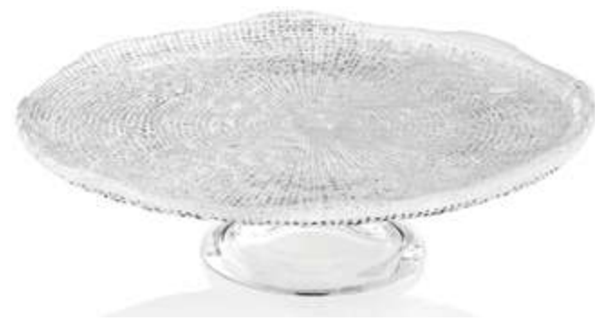
5541.1 / 5542.1