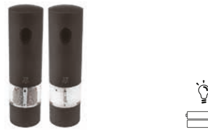
ONYX Pepper/salt mill Macina pepe/sale Pfeffer-/Salzmühle Moulin à poivre/sel Molinillo pimienta/sal