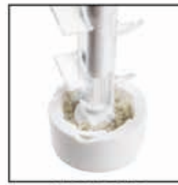
WET SEA SALT