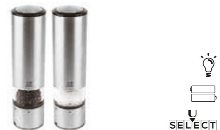
ELIS SENSE Pepper/salt mill Macina pepe/sale Pfeffer-/Salzmühle Moulin à poivre/sel Molinillo pimienta/sal