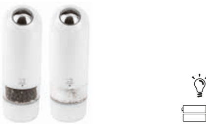
ALASKA Duo, electric pepper/salt mill Duo, macinapepe/sale, elettrici Duo, Pfeffer-/Salzmühle Duo, moulin à poivre/sel Duo, molinillo pimienta/sal