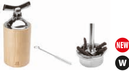
ISEN Long pepper mill Macinapepe lungo Langer Pfeffermühle Moulin à poivres longs Molinillo de pimienta larga