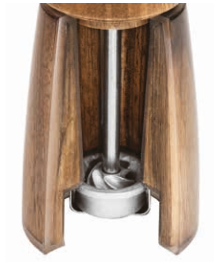
TABLE TOP TAVOLA PEUGEOT MILLS MACINE

Walnut. Cap highly matt finish, body brilliant finish in an acrylic envelope protecting the wood against humidity. – Noce. Testa finitura opaca, corpo finitura brillante racchiuso in acrilico che protegge il legno dall'umidità.