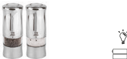
ZELI Pepper/salt mill Macina pepe/sale Pfeffer-/Salzmühle Moulin à poivre/sel Molinillo pimienta/sal

ABS stainless steel look. Soft touch. ABS imitazione inox. Soft touch.