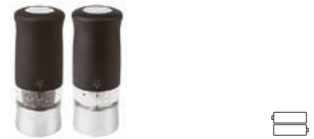
ZEPHIR Pepper/salt mill Macina pepe/sale Pfeffer-/Salzmühle Moulin à poivre/sel Molinillo pimienta/sal