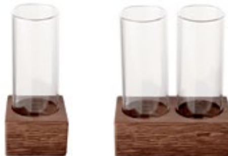
Set 1/2 boro sch.s+walnut tray A1062-1100RF box: 6 5.5x5.5cm / 2.2x2.2" / 65ml A1062-2100RF box: 3 8.5x4.5cm / 3.3x1.8" / 2x65ml