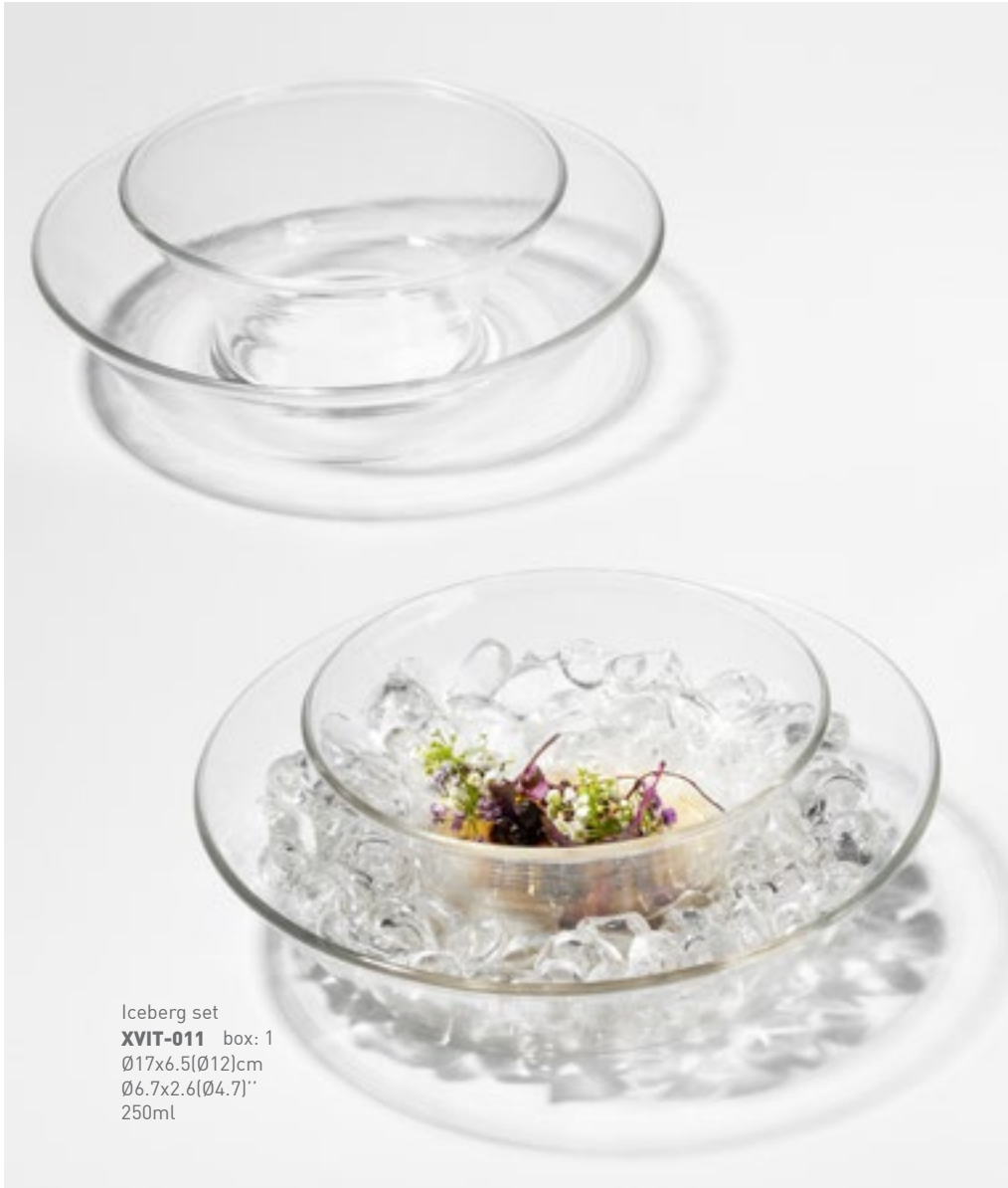
Iceberg set XVIT-011 box: 1 Ø17x6.5(Ø12)cm Ø6.7x2.6(Ø4.7)" 250ml