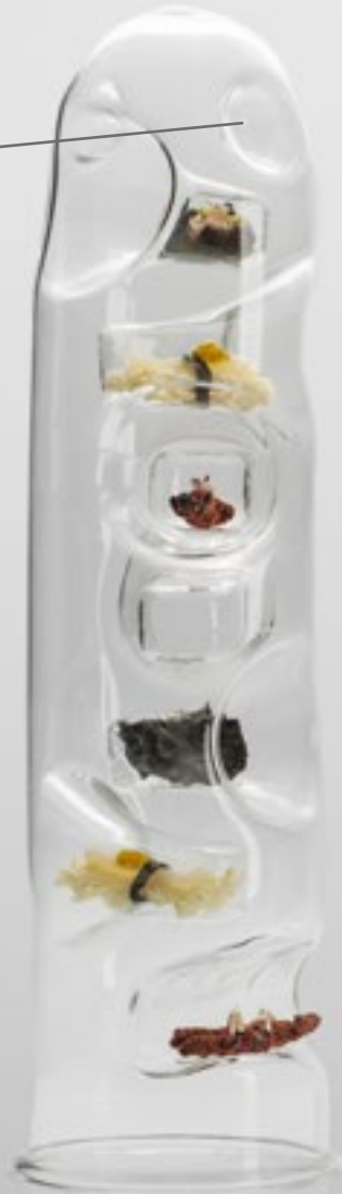
7 appetitive boro tower XIDEE-200 box: 1 Ø12x48cm / Ø4.7x18.9"