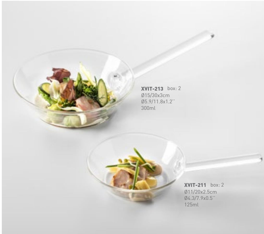
XVIT-213 box: 2 Ø15/30x3cm Ø5.9/11.8x1.2" 300ml