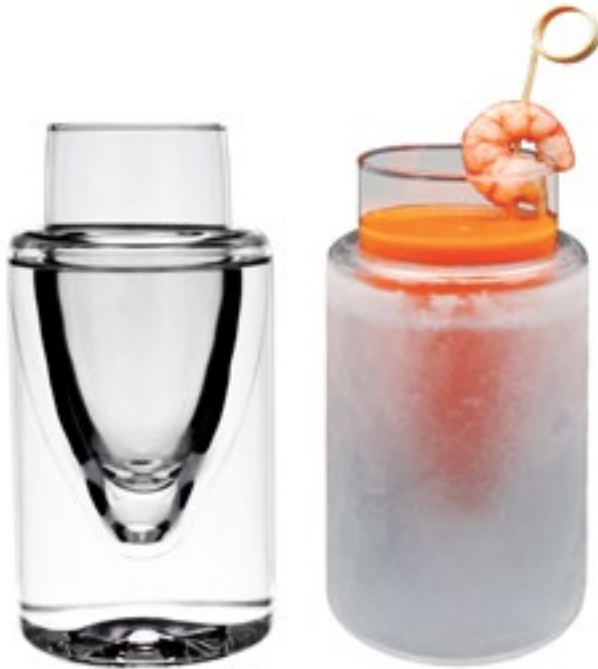
XVIT-003 box: 1 12.5x6/8.5x4cm 4.3x2/6.3x3.1" 130ml