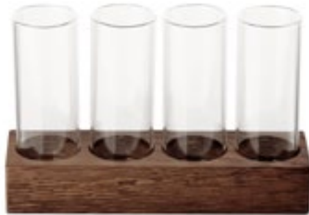
Set 4 boro sch.s+walnut tray A1062-4100RF box: 3 16x5cm / 6.3x2" / 4x65ml