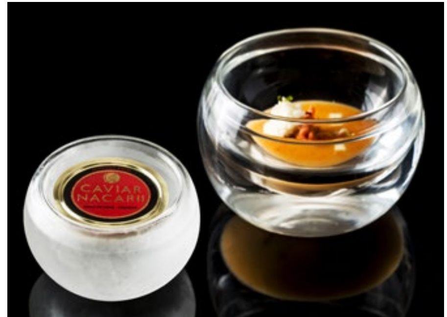
XVIT-008 box: 1 10x7(Ø7.5)cm 3.9x2.8(Ø3)" / 100ml