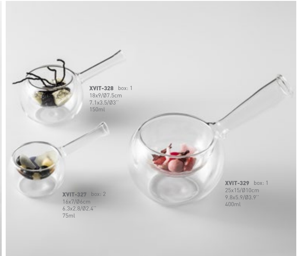
XVIT-328 box: 1 18x9/Ø7.5cm 7.1x3.5/Ø3" 150ml