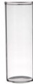
XVIT-0100 box: 6 Ø3x9cm Ø1.2x3.5" 65ml