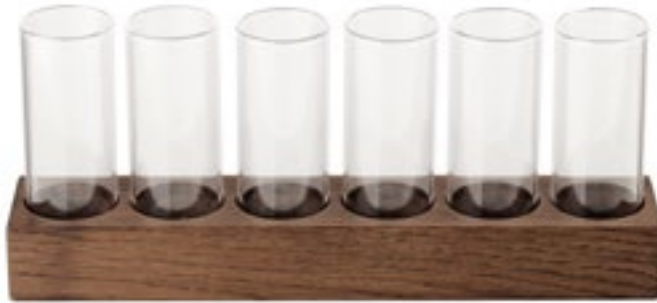
Set 6 boro sch.s+walnut tray A1062-6100RF box: 1 24x4.5x3cm / 9.4x1.8x1.2" / 65x6ml