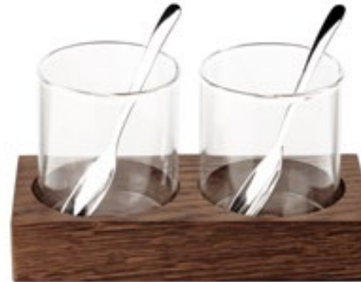
Set 2 boro sch.s+walnut tray+spoon A1062-2102RF box: 1 15x7cm / 5.9x2.8" / 2x150ml