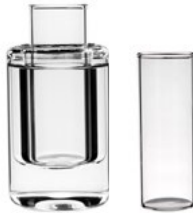
XVIT-002 box: 4 9x4.5/7x2.5cm 3.5x1.2/4.7x2.4" 65ml