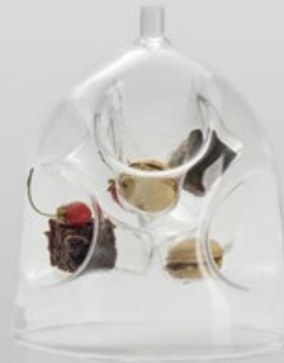
5 appetitive boro dome XIDEE-199 box: 1 Ø17x20cm / Ø6.7x7.9"

Exclusive designs that brighten the table thanks to their original shape and volume. Perfect for appetisers or petits fours, they allow infinite creations which will surprise the diners.