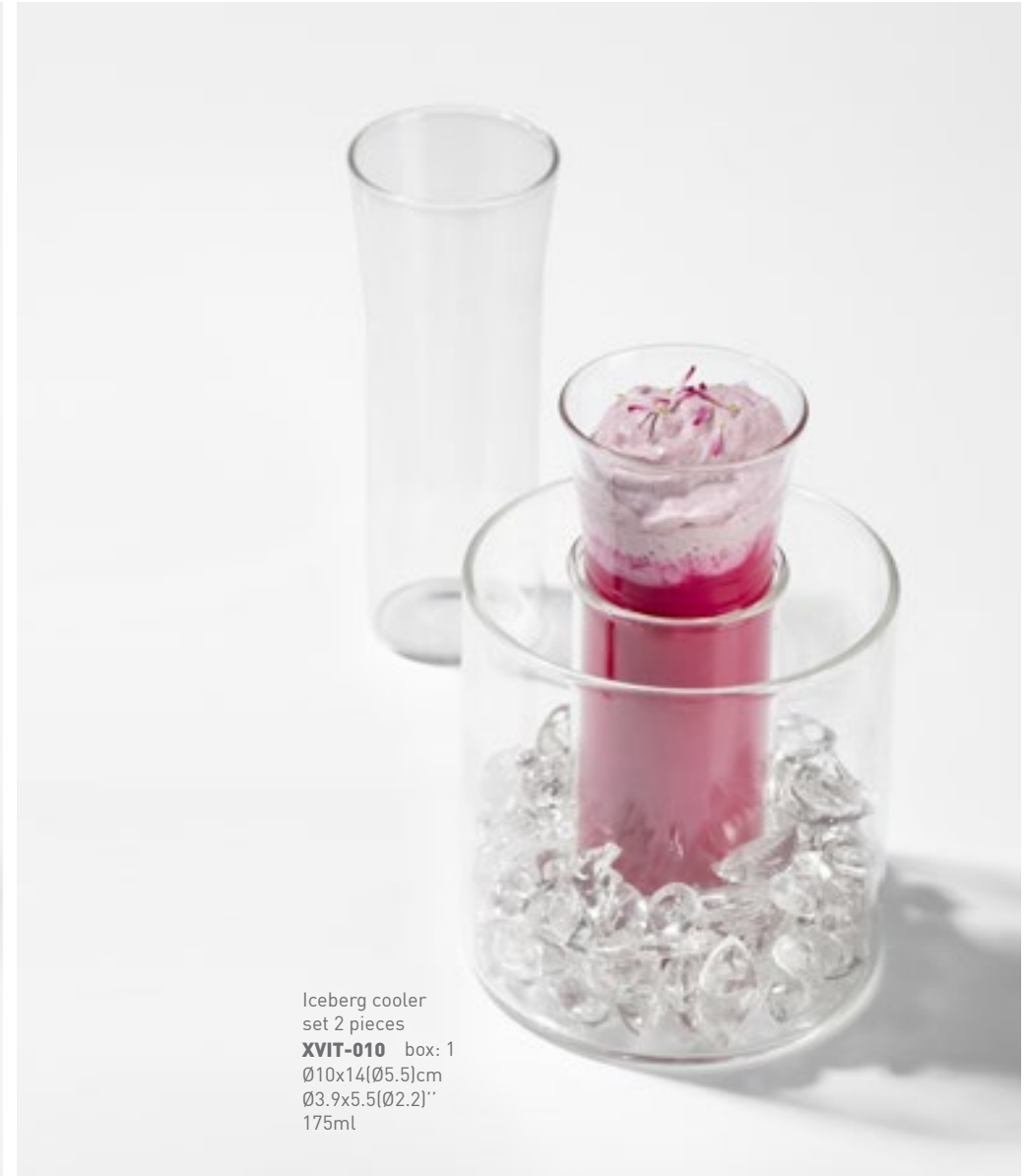
Iceberg cooler set 2 pieces XVIT-010 box: 1 Ø10x14(Ø5.5)cm Ø3.9x5.5(Ø2.2)" 175ml