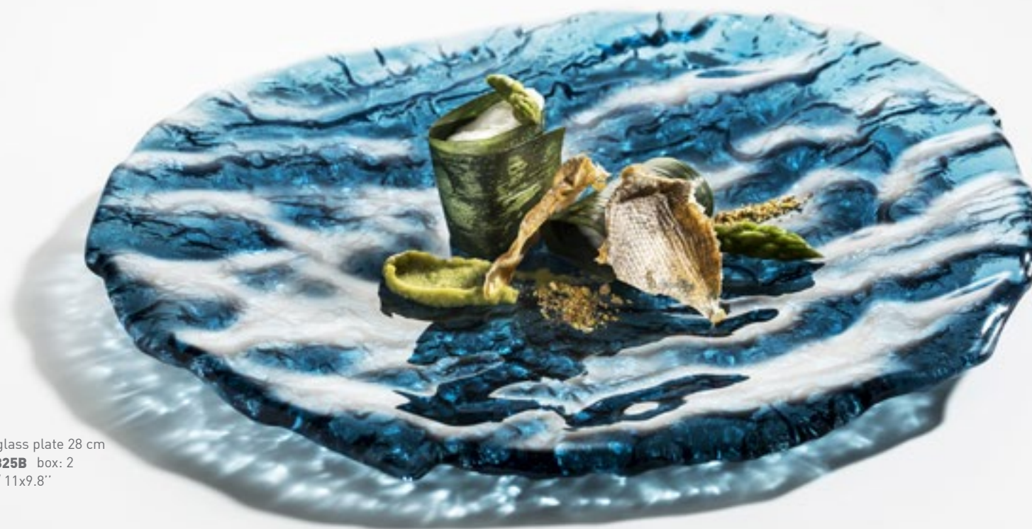
Mar blue glass plate 28 cm XGLAS-2825B box: 2 28x25cm / 11x9.8"