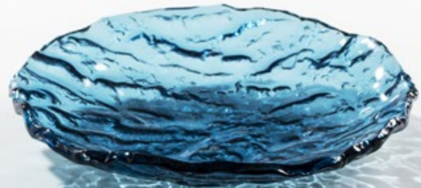
Mar blue glass oval bowl 23 cm XGLAS-2817B box: 4 23x17cm / 9.1x6.7" / 250ml