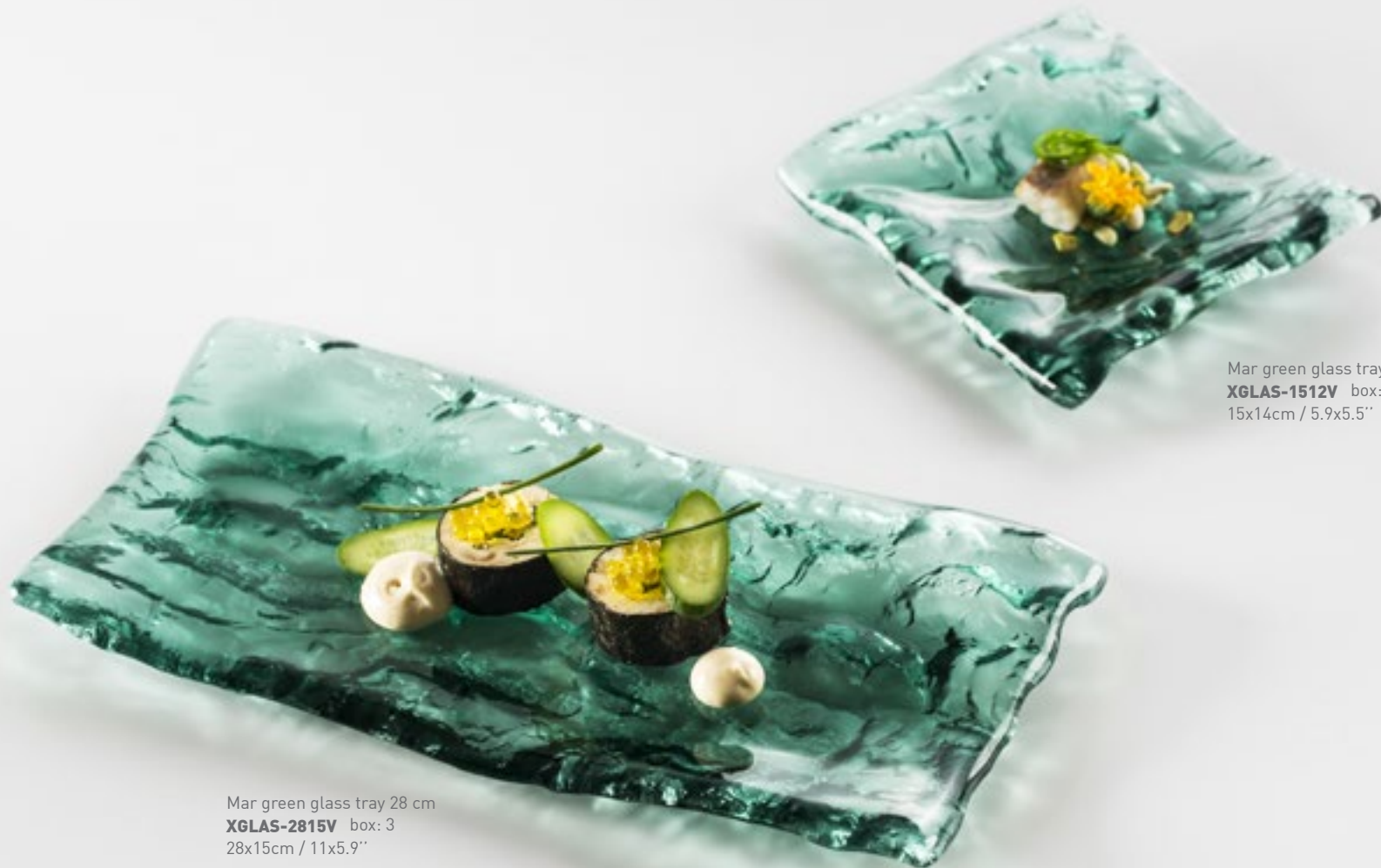
Mar green glass tray 28 cm XGLAS-2815V box: 3 28x15cm / 11x5.9"