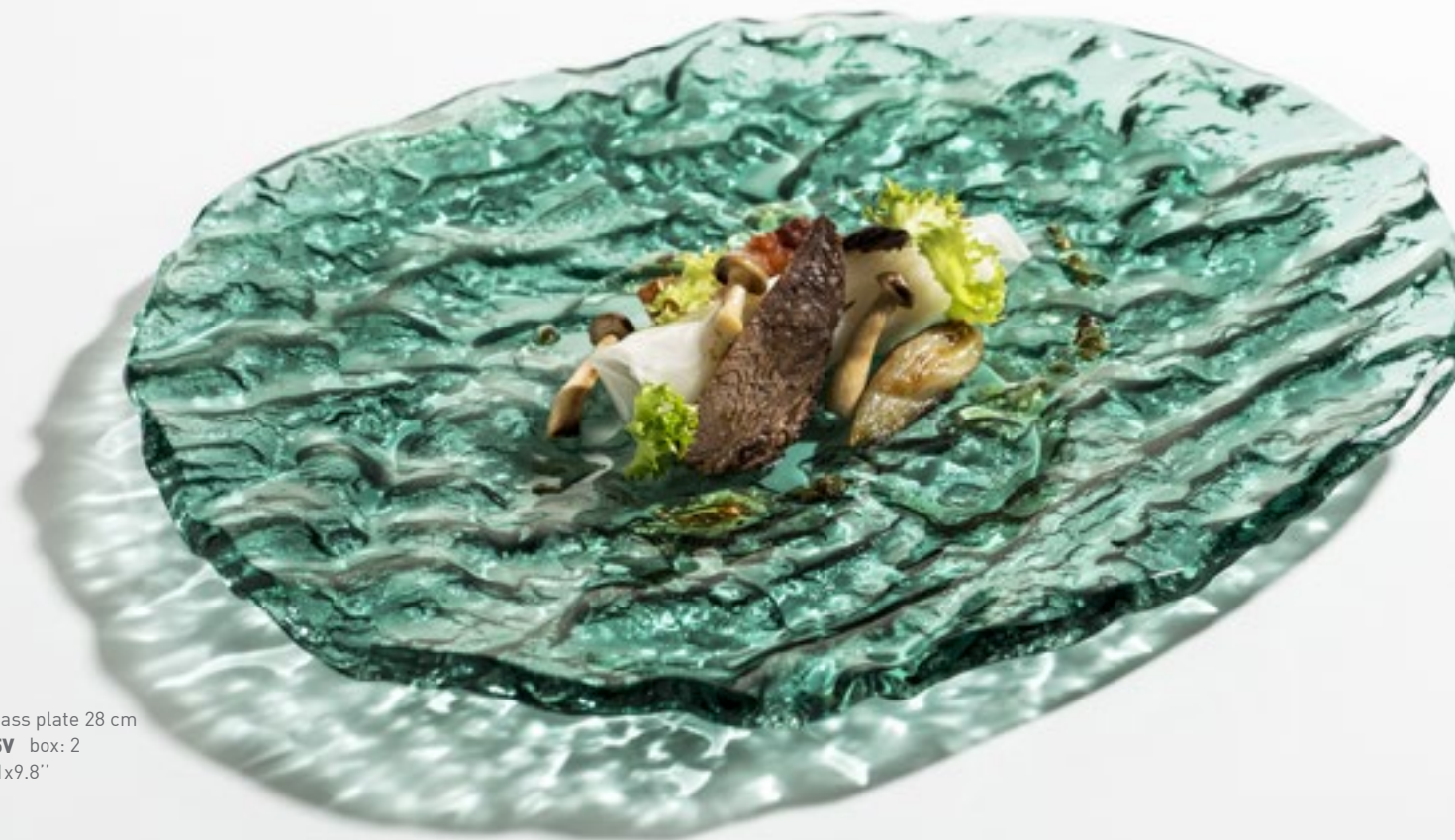
Mar green glass plate 28 cm XGLAS-2825V box: 2 28x25cm / 11x9.8"