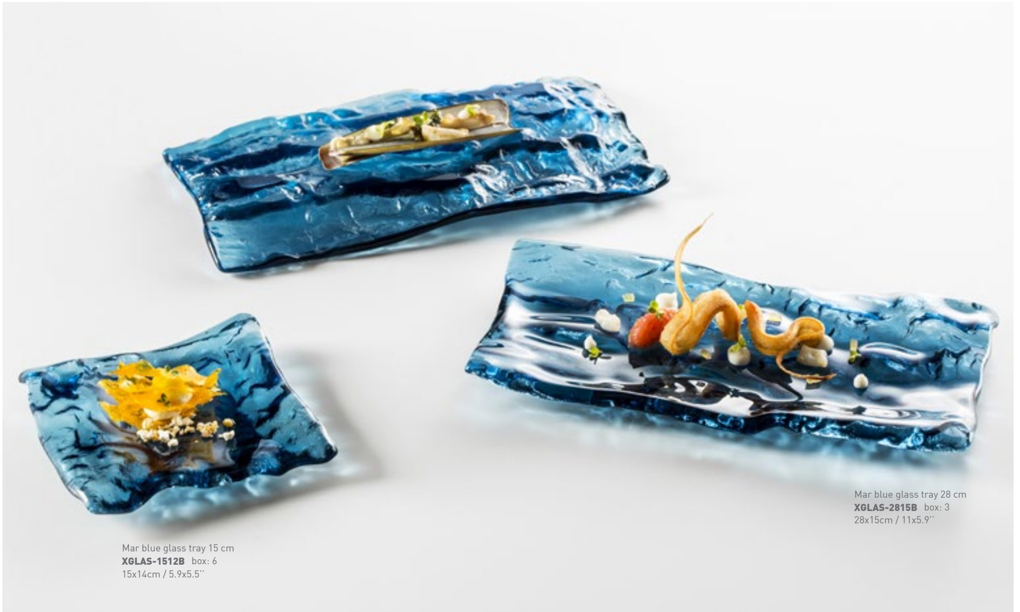
Mar blue glass tray 15 cm XGLAS-1512B box: 6 15x14cm / 5.9x5.5"