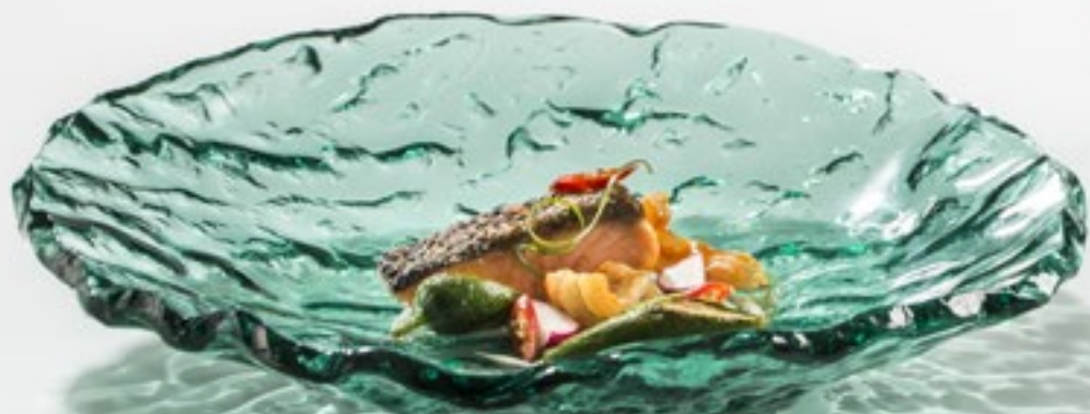
Mar green glass bowl 24 cm XGLAS-2824V box: 2 Ø24cm / Ø9.4" / 250ml